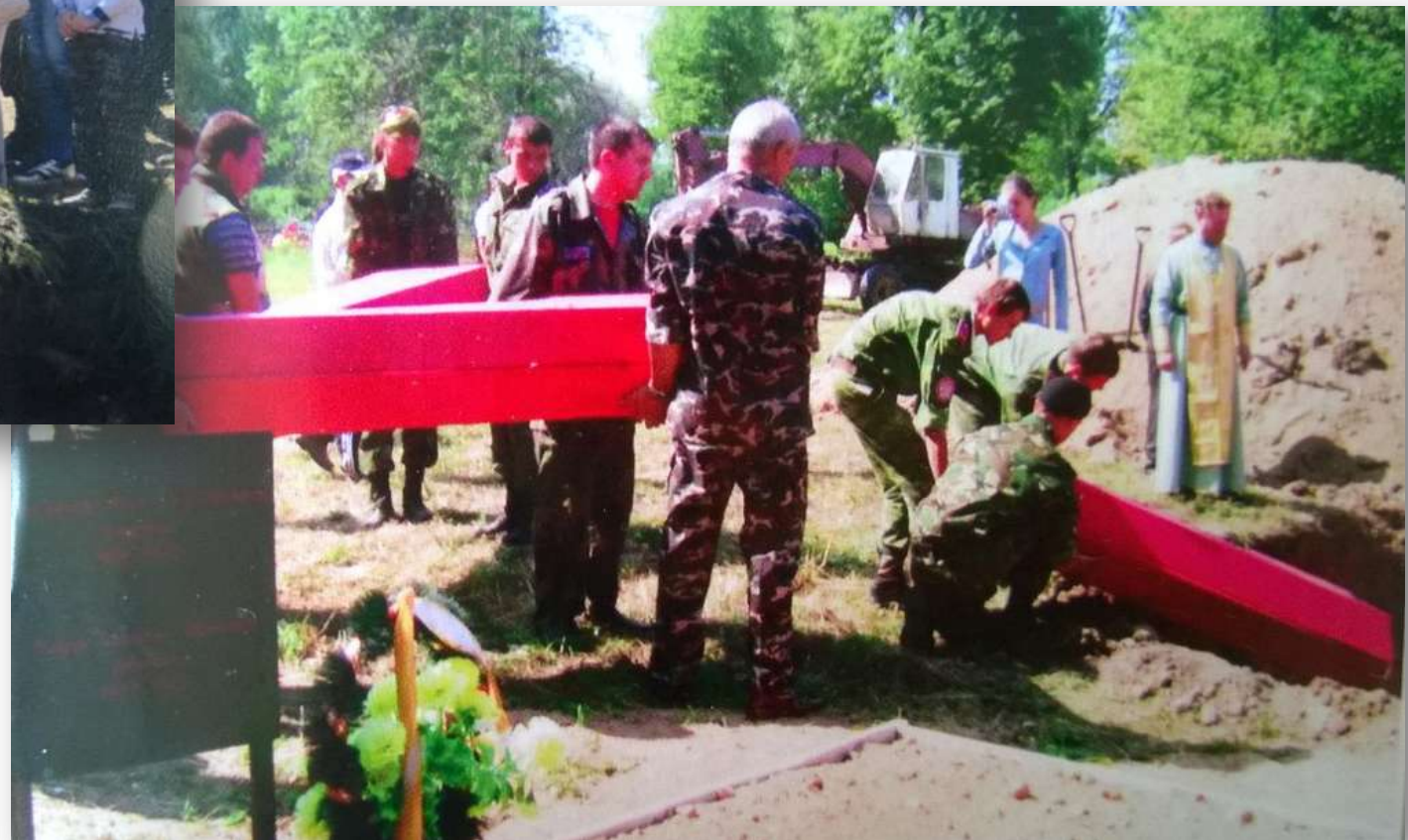
Захоронение останков воинов, найденных поисковым отрядом «Подвиг» на территории Бельского района. 2010 г.